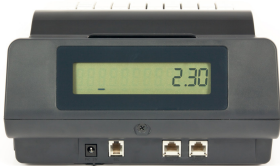
Die Rückansicht der ER-230 mit den Schnittstellen für Netzanschluss, Schublade und den beiden seriellen Schnittstellen