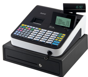
Die ECR-1880 mit Hubtastatur (Die Abbildung zeigt als Sonderausstattung das Addinat Kellnerschloss)

Die Tastatur, die Wahlweise als Flach- oder als Hubtastatur erhältlich, ist frei programmierbar. So lässt sich das System auf Ihre Anforderungen einrichten. Nützliche Funktionen wie z.B. Menüfenster vereinfachen die Bedienung und verkürzen Einweisungszeiten. Leistungsrahmen