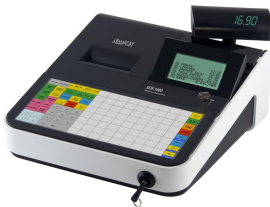
Abbildung mit optional erhältlichem Kellnerschloss

Die Tastatur, die Wahlweise als Flach- oder als Hubtastatur erhältlich, ist frei programmierbar. So lässt sich das System auf Ihre Anforderungen einrichten. Nützliche Funktionen wie z.B. Menüfenster vereinfachen die Bedienung und verkürzen Einweisungszeiten.