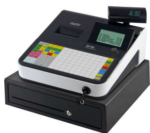
Abbildung zeigt die ECR-1880 mit der Sonderausstattung Kellnerschloss

Die Tastatur, die Wahlweise als Flach- oder als Hubtastatur erhältlich, ist frei programmierbar. So lässt sich das System auf Ihre Anforderungen einrichten. Nützliche Funktionen wie z.B. Menüfenster vereinfachen die Bedienung und verkürzen Einweisungszeiten. Leistungsrahmen